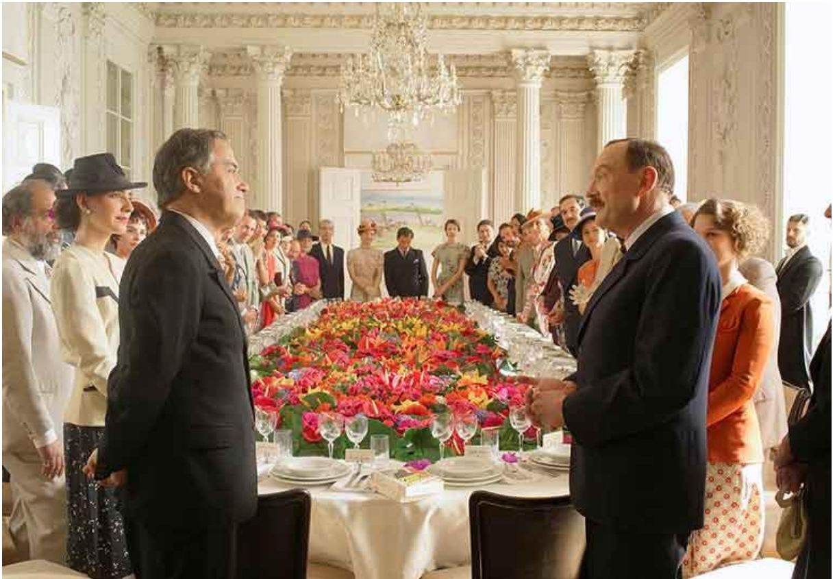
En las puertas de la celebración del Congreso de Escritores, Buenos Aires, 1936

Bellas imágenes, la mayoría. La música, de Wagner, lo leí al principio, aunque la primera vez que vi el film, no fui consciente de ésta, dada la intensidad de la cinta.